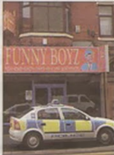
The defendants' takeaway

men were DNA tested and a TV appeal for information was broadcast on the BBC's Crimewatch show.